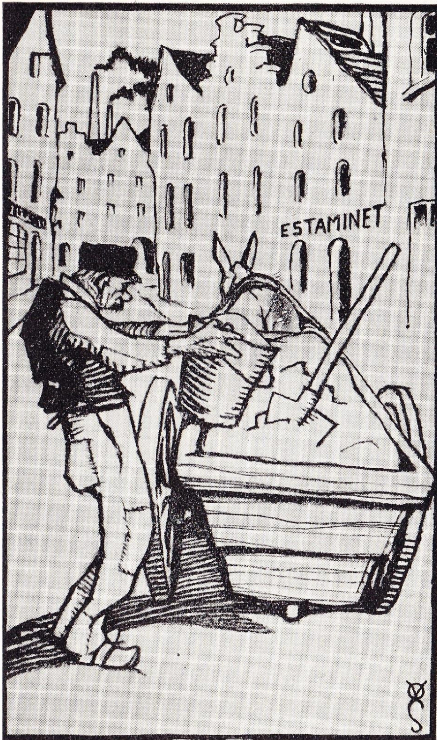
« De Zandboer » / « Le Zandboer » op bladzijde 92 bis / page 92bis hoofdstuk (17) / chapitre (17)