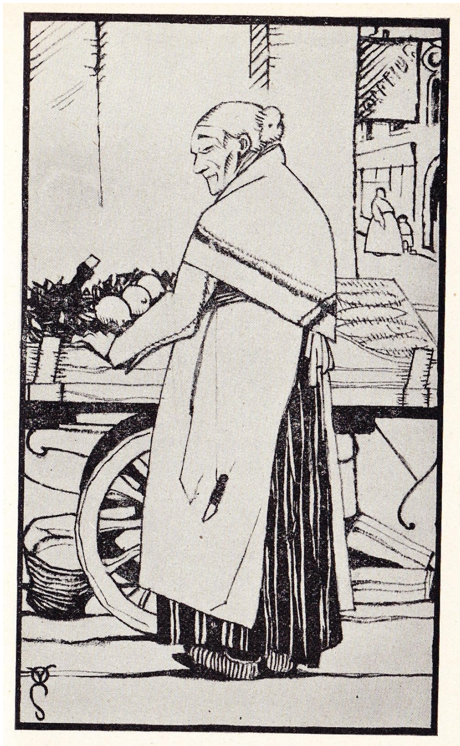
« Het mosselwijveken » / « La Marchande de Moules » op bladzijde 47bis / page 47bis hoofdstuk (8) / chapitre (8)