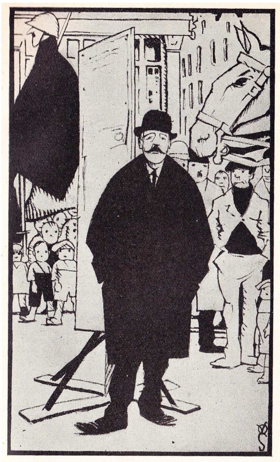
« De Beul » / « Le Bourreau » op bladzijde 160bis / page 160bis hoofdstuk (29) / chapitre (29) :